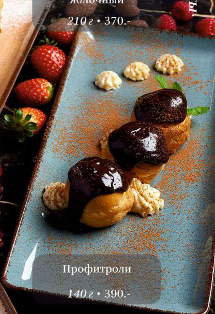
Профитроли 140 г • 390.-