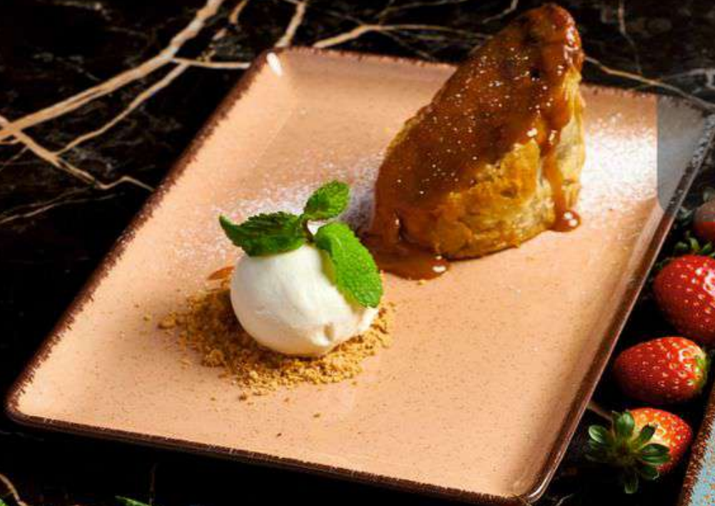
Штрудель яблочный 210 г • 370.-