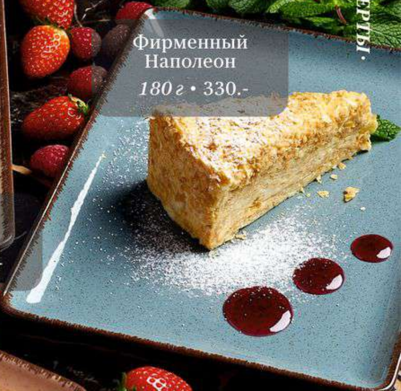
Фирменный Наполеон 180 г • 330.-