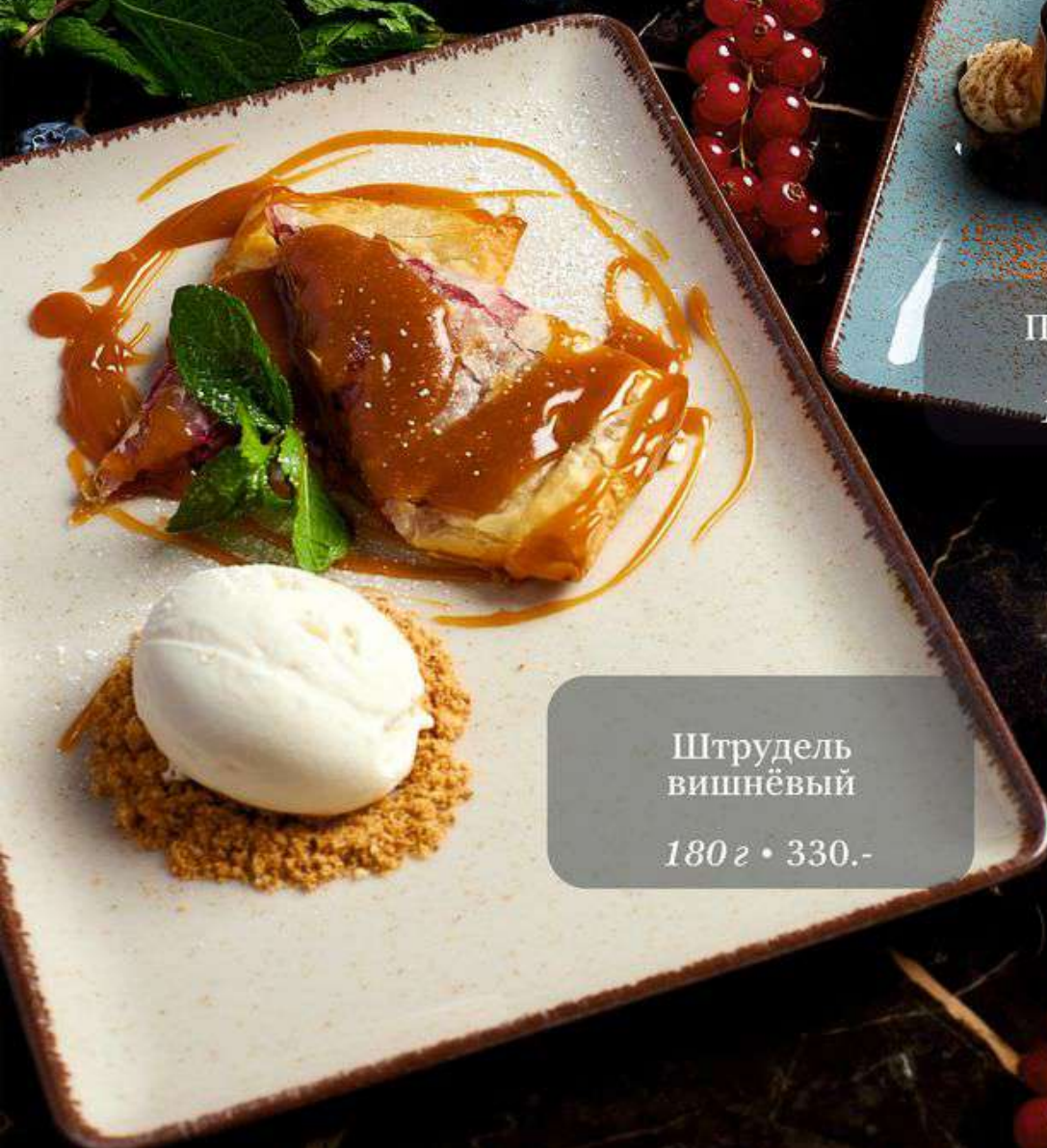
Штрудель вишнёвый 180 г • 330.-